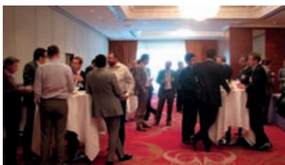
Impressionen der internationalen Fast Moving Consumer Goods (FMCG)-Konferenz "Horizontal Collaborations in the FMCG Sector" in Brüssel, Juni 2010.