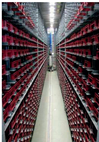
Blick in eine AKL-Gasse des neuen zentralen Versorgungszentrums in Berlin.

Berlin. Im ständigen Bemühen, Kosten einzusparen und Prozesse zu verbessern, wurden auf Basis einer detaillierten Potenzialanalyse die gesamten Logistikprozesse der Siemens AG, Sektor Transmission Division High Voltage (ETH) Berlin, auf Lean Production umgestaltet. Im Zuge der Neustrukturierung wurden die vormals sechs dezentralen Versorgungsläger sowie die Außenläger in ein zentrales Versorgungszentrum mit Technologien und Prozessen nach neuestem Stand integriert.