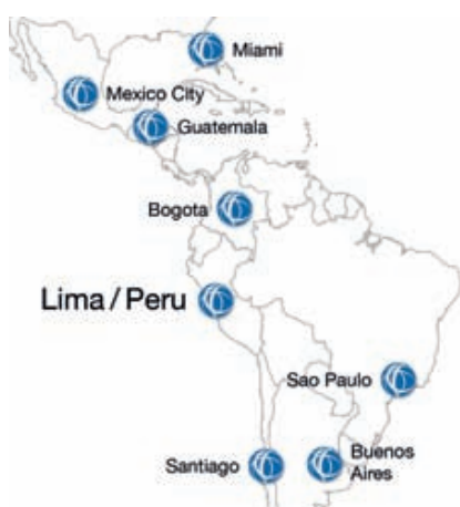
Das neue Miebach-Büro in der Hauptstadt Perus ist nun eines von sieben Niederlassungen in Süd- und Mittelamerika.