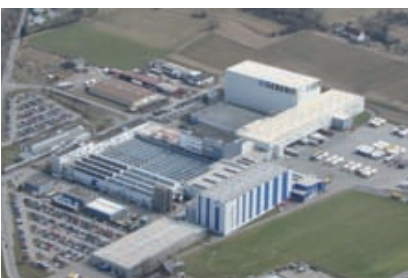
La empresa suiza Geberit, líder del mercado europeo en tecnología sanitaria, ha inaugurado recientemente su nuevo centro logístico en Pfullendorf (Baden Wuerttemberg, Alemania).

Con una inversión de 27 millones de euros, la compañía Geberit ha reestructurado el centro para poder distribuir sus productos a nivel internacional. Actualmente, el nuevo centro de distribución suministra un amplio rango de productos a más de 5.000 clientes distribuidos por 100 países. Este ha sido el proyecto con una mayor inversión de la historia de Geberit, y ha contado con la colaboración de Miebach Consulting durante todo el proceso de planificación.