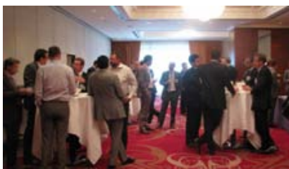
Imágenes de la conferencia sobre FMCG “Colaboraciones horizontales en la cadena de suministro” en Bruselas.