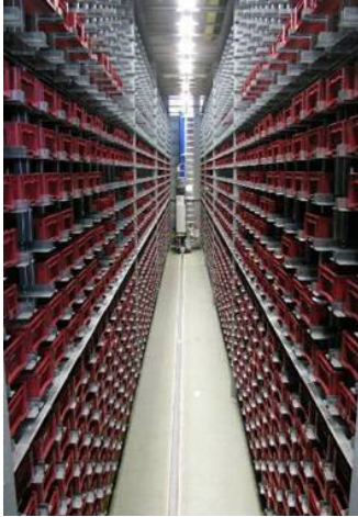
Detalle del almacén de Siemens ETH en Berlín.

Berlín. Como parte de los constantes esfuerzos para reducir costes y optimizar procesos, Siemens ETH, la división de Siemens AG dedicada al sector energético, ha reestructurado sus procesos logísticos a través de la aplicación de métodos lean de producción, basándose en un detallado análisis de potenciales. Este plan de reestructuración ha consistido, entre otras cosas, en integrar los seis depósitos antiguos de suministro descentralizado y áreas externas de almacenamiento en un centro de suministro central que cuenta con procesos y tecnología punta.