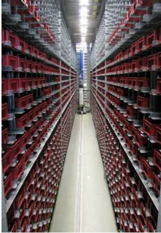
Detalhe do armazém da Siemens ETH em Berlim.