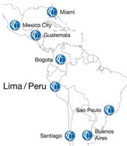
O novo escritório da Miebach em Lima é o sétimo da companhia nas Américas do Sul e Central.